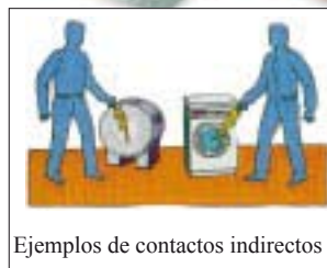
Ejemplos de contactos indirectos

Con respecto al último aspecto, la resistencia eléctrica del cuerpo varía según las condiciones físicas y psíquicas del sujeto y del estado de su piel (seca-mojada).