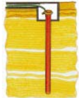
Electrodos verticales (Barras).

De acuerdo con las dimensiones de terreno disponible para la ejecución de una puesta a tierra y de costo, se usan los siguientes tipos de elementos para su construcción: